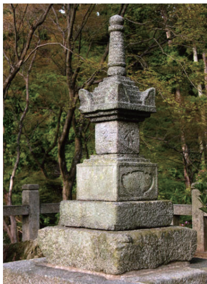
7. 岡寺寶篋印塔 (日本奈良縣高市郡)