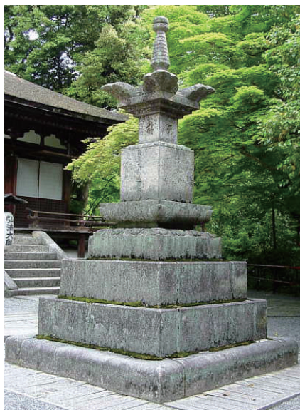
12. 石山寺寶篋印塔 (日本滋賀縣大津市)