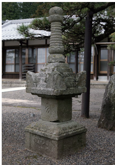
16. 慈眼院寶篋印塔 (日本滋賀縣蒲生郡，1339年造)