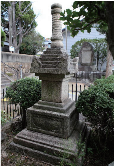
22. 光明寺寶篋印塔 (日本広島縣尾道市)