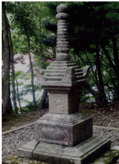
13. 温泉寺寶篋印塔 (日本兵庫縣豊岡市)