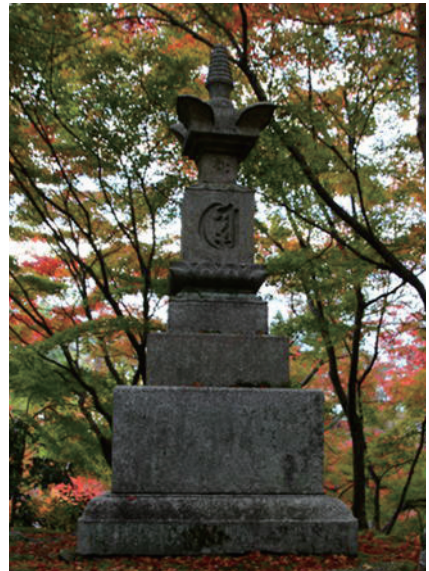
21. 禪林寺寶篋印塔 (日本京都市)