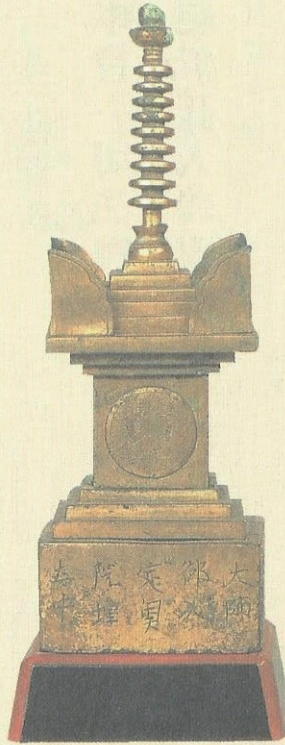
南保又二郎，金剛峰寺（公元1287年）