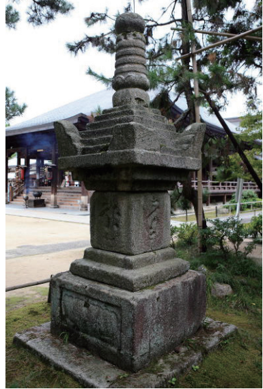
19. 智恩寺寶篋印塔 (日本京都府宮津市)