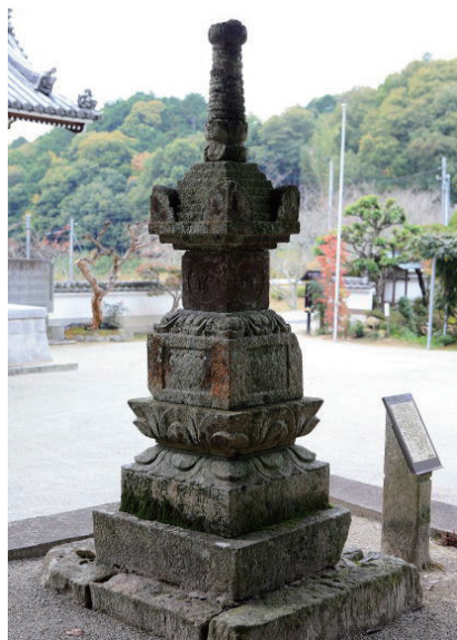
11. 善光寺寶篋印塔 (日本兵庫縣宝塚市，1350年造)