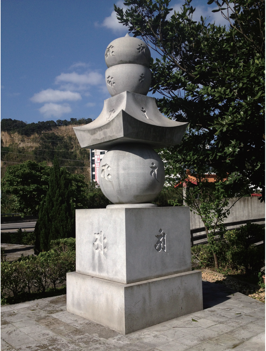
23. 福慧寺五輪塔 (台灣樹林)