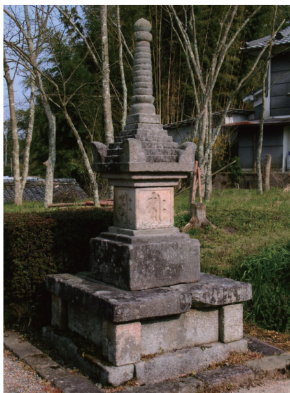
8. 青龍寺寶篋印塔 (日本奈良市蘭生町)