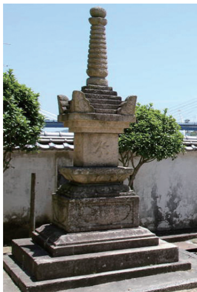
14. 浄土寺寶篋印塔 (日本広島縣尾道市，1348年造)