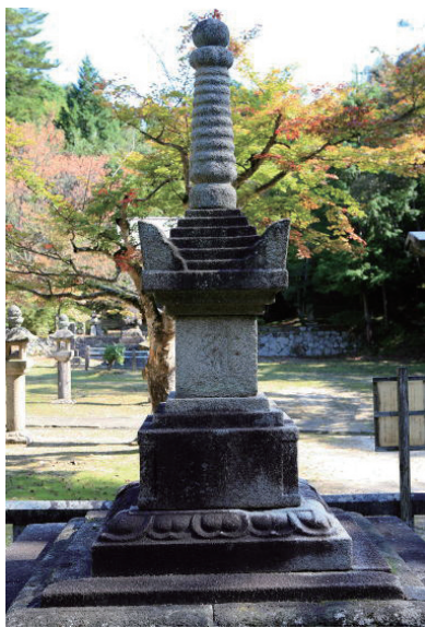
15. 緣城寺寶篋印塔 (日本京都府京丹後市，1351年造)