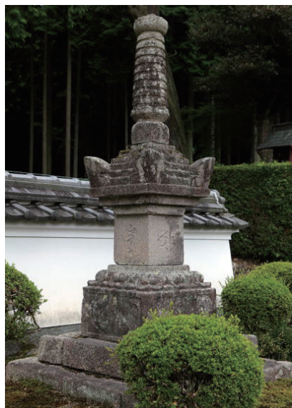
17. 万松寺寶篋印塔 (日本兵庫縣丹波市)