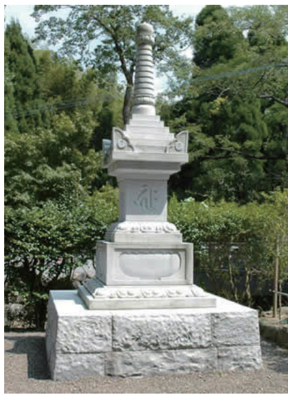
9. 鎮國寺頂峯院寶篋印塔 (日本鹿兒島縣いちき串木野市)