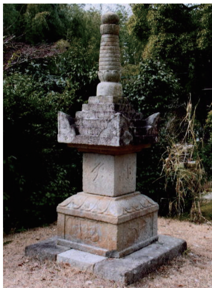
18. 梵釋寺寶篋印塔 (日本滋賀縣東近江市，1328年造)