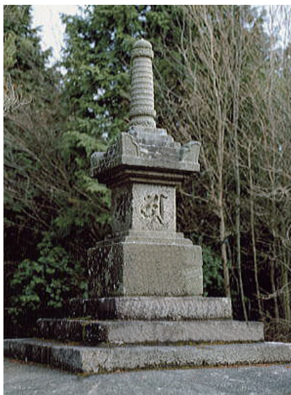
10. 金胎寺寶篋印塔 (日本京都府相樂郡・1300年造)