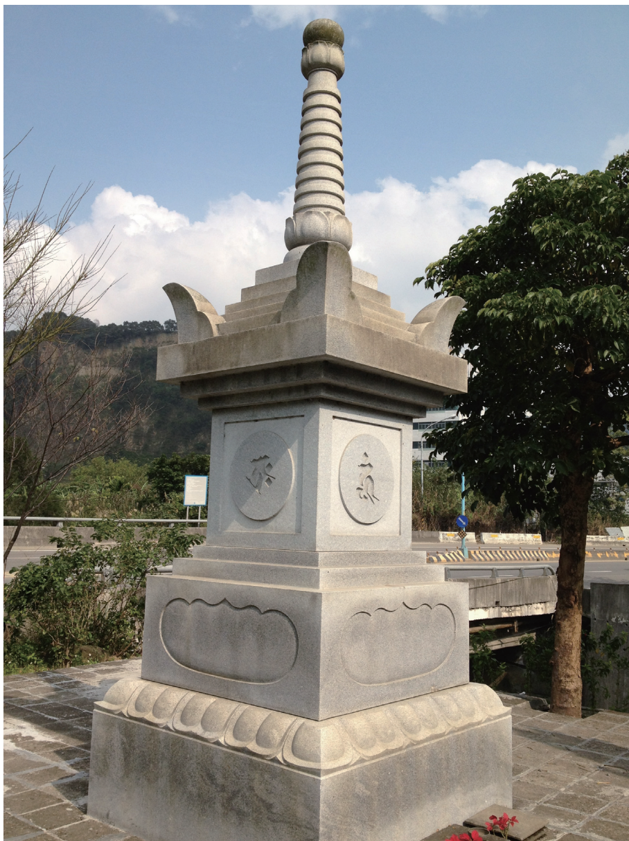
5. 福慧寺寶篋印塔 (台灣樹林)