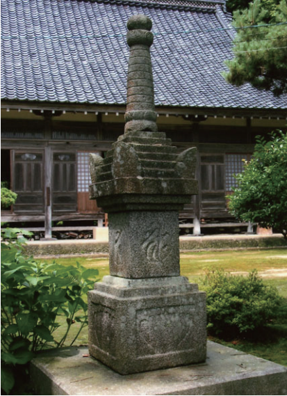
20. 玉田寺寶篋印塔 (日本兵庫縣新溫泉町)